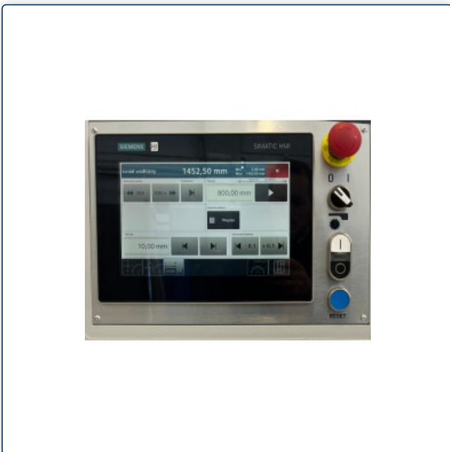
Sägeblattneigung und Höhenverstellung sowie Positionierung des Parallelanschlags einstellbar über ein Bedienpanel mit SIEMENS-Steuerung und 10" großem Touchdisplay