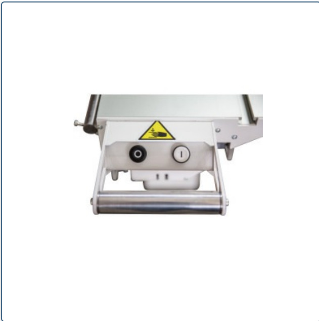
Ein-/ Ausschalter am Schiebeschlitten