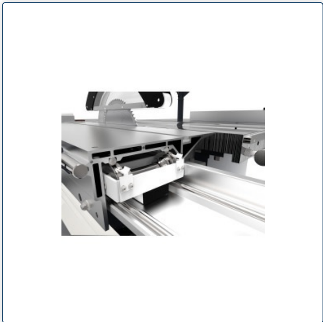
Vierfach gelagerter Formatschiebeschlitten mit extrem leichten und präzisen Lauf