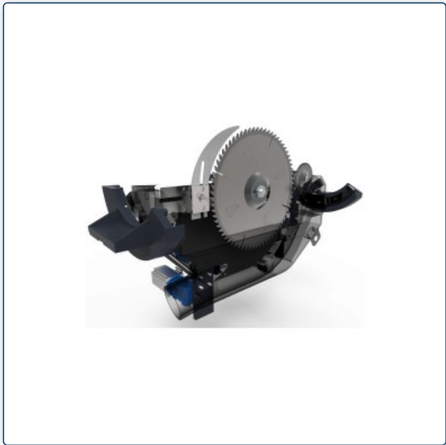
Werkzeuglose Sägeblattklemmung über Rapid-System