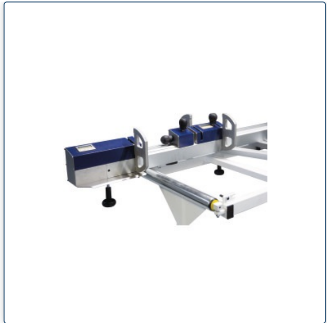
Zwei Klappanschläge am Längsanschlag und digitale Positionsanzeige