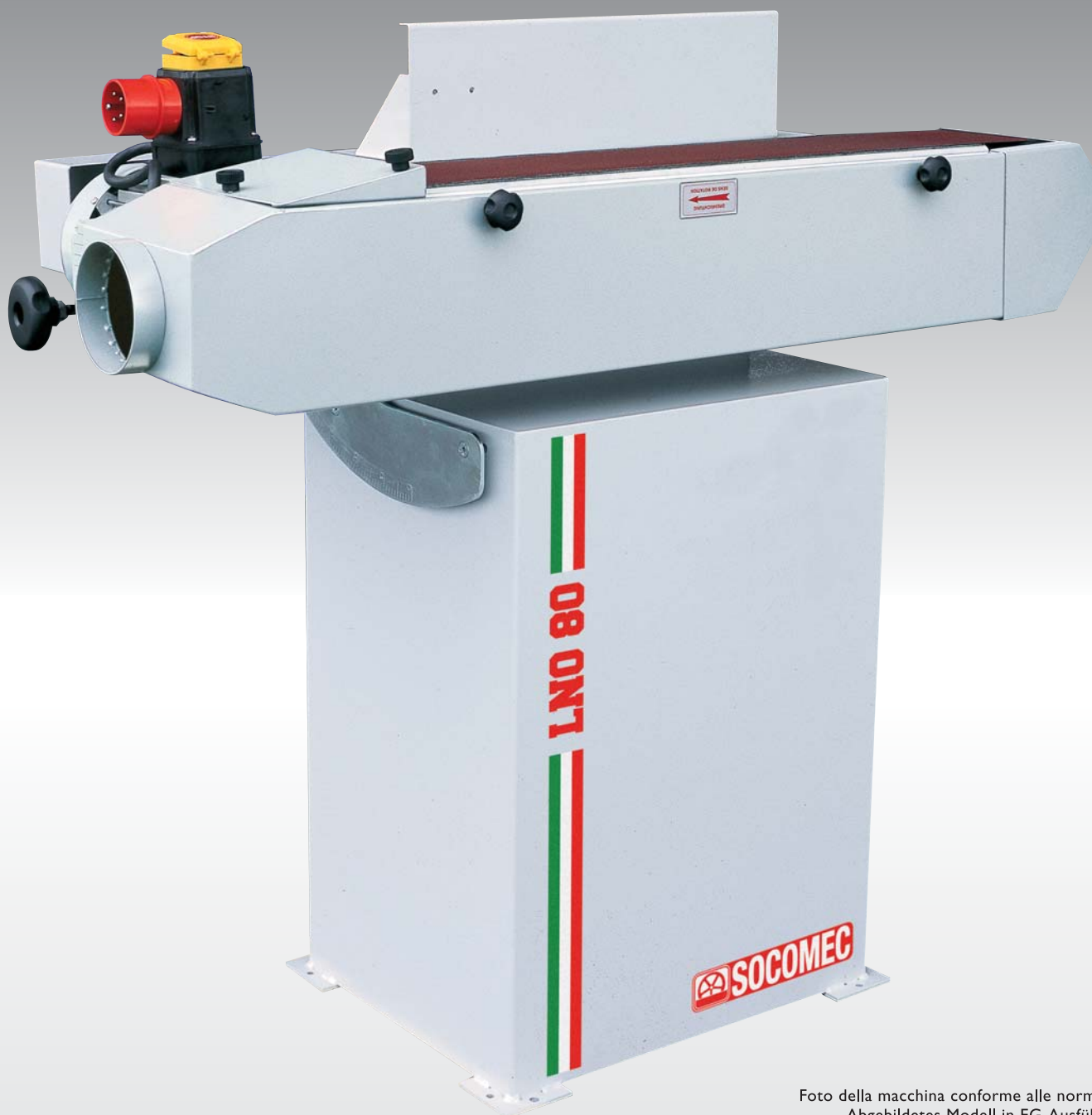
Foto della macchina conforme alle norme CE • Abgebildetes Modell in EG-Ausführung • Picture of the machine in CE version • Photo de la machine conforme aux normes CE • Foto de la maquina conforme normas CE •

LEVIGATRICE PER BORDIA NASTRO OSCILLANTE KANTENSCHLEIFMASCHINE MIT BAND OSZILATION EDGE SANDING MACHINE WITH OSCILLATING BELT PONCEUSE DE CHANTS À BANDE OSCILLANTE LIJADORA DE CONTORNOS CON BANDA OSCILLANTE