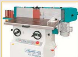
Jederzeit nachrüstbar zur Furnierschleifmaschine