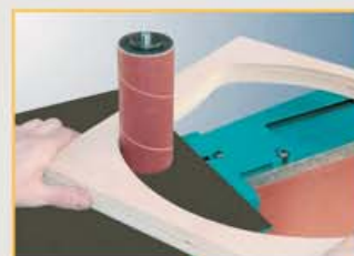
Und noch mehr Schleifen