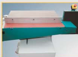
Schleifaggregat neigbar 0-90°