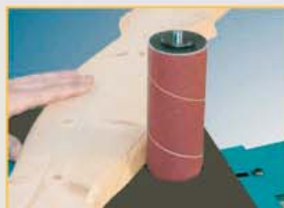
Unbegrenzte Schleifmöglichkeiten - hier Zusatztisch mit Rundschleifeinrichtung