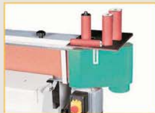
Optionaler Zusatztisch mit Rundschleifeinrichtung