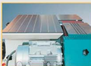
Massiver, höhenverstellbarer Maschinentisch mit Gleitbelag – Schleifaggregat schwenkbar 0-90°