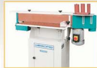
KS2250P mit größerem Maschinenstand und Auflagetisch.