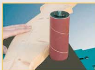
Unbegrenzte Schleifmöglichkeiten - hier Zusatztisch mit Rundschleifeinrichtung