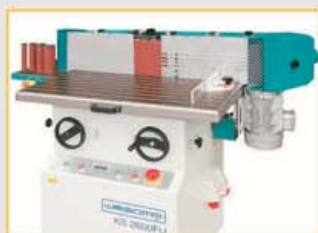
Jederzeit nachrüstbar zur Furnierschleifmaschine