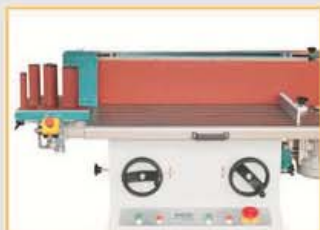
KS2600 mit Handradverstellung und Digitalanzeige