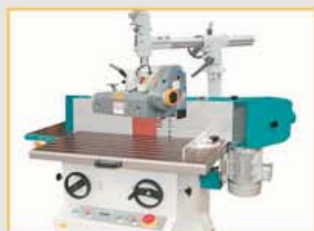
KS2600FU hier mit WEGOMA Vorschub (nicht im Lieferumfang) auf serienmäßiger Vorschubkonsole