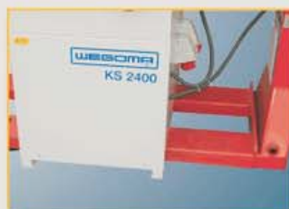
KS2400 – Massiv, variabel und durchdacht