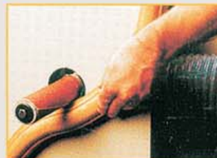
Schleifen am Zusatztisch (Option)