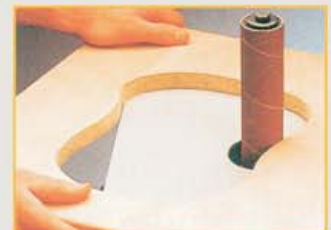
Schleifen am Zusatztisch (Option)