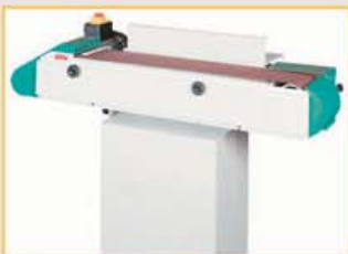
Schleifaggregat manuell schwenkbar 0° - 90°