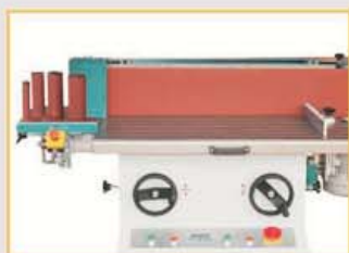
KS2600 mit Handradverstellung und Digitalanzeige